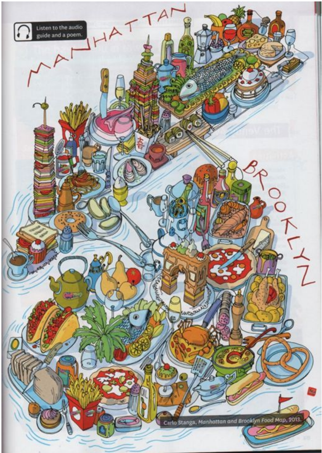
Carlo Stanga, Manhattan and Brooklyn Food Map, 2013.